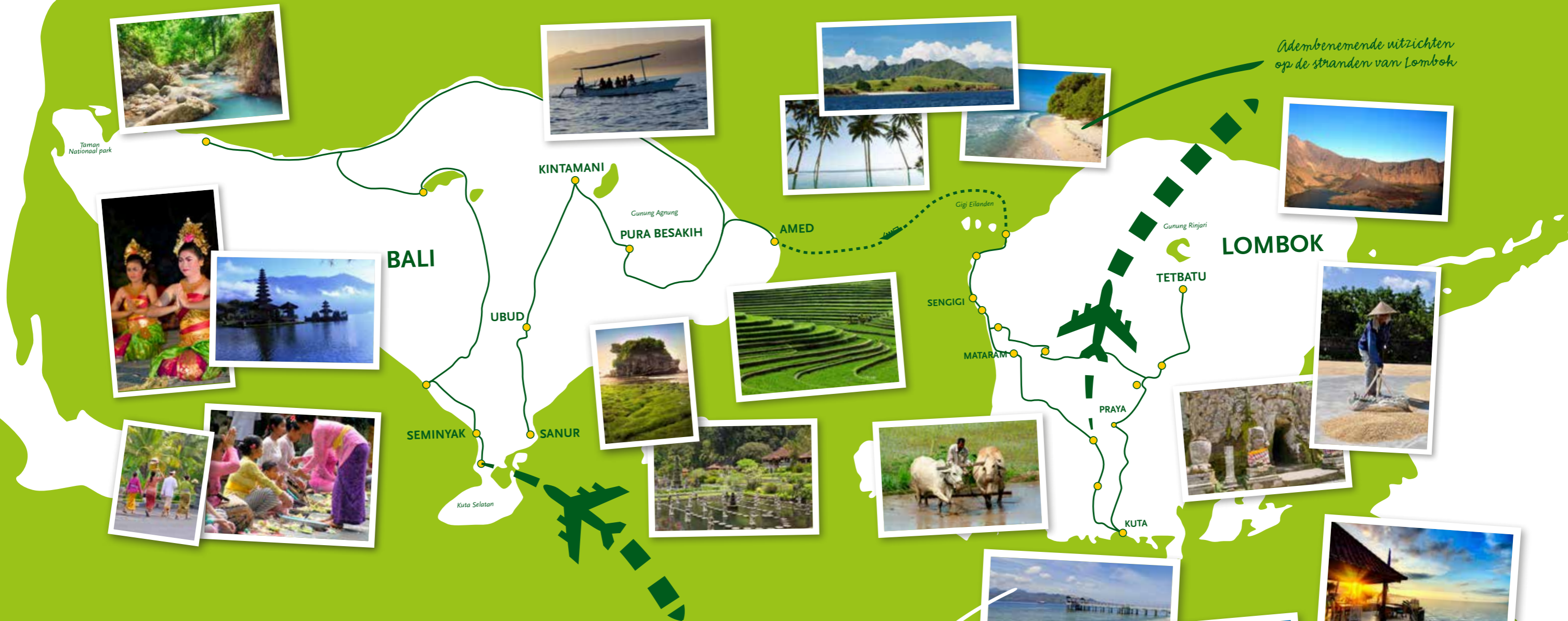
Adembenemende uitzichten op de stranden van Lombok